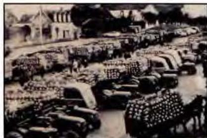
SICA de Saint-Pol-de-Léon

Course-croisière entre Morlaix et Guernesey, le Tresco a fêté cette année ses 30 ans par une météo musclée. Il a rassemblé depuis ses débuts plus de 3 300 bateaux.