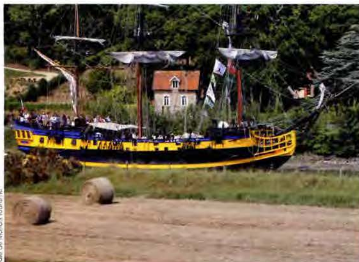
Baie de Morlaix Tourisme

Comme par magie, un vieux gréement apparaît au milieu des champs et des bois. À ne pas manquer : la parade sur la rivière de Morlaix.