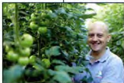
SICA de Saint-Pol-de-Léon - E. Poin