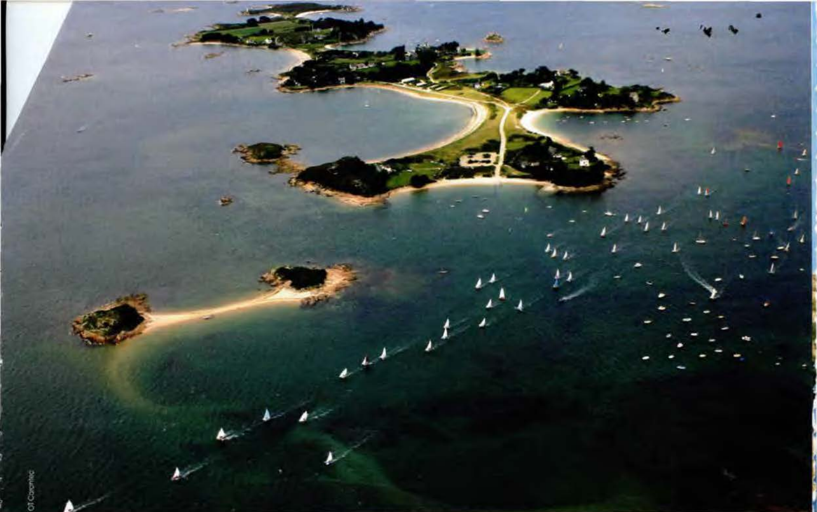
En saison, pas un dimanche sans une régate ! L'Union nautique de la baie de Morlaix est très active.