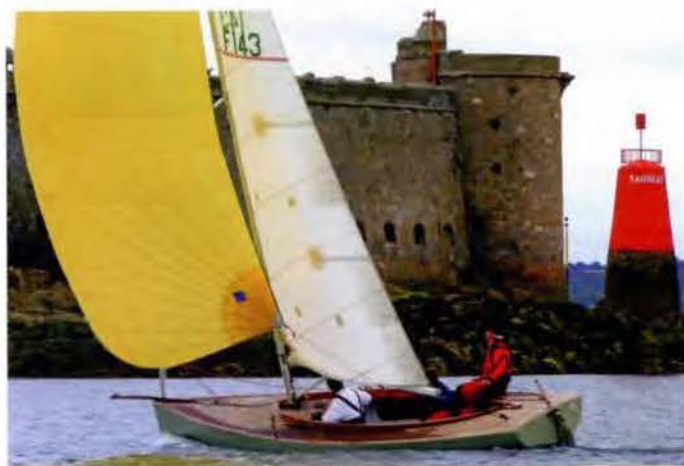
Toute la magie de la baie avec ce cormoran sous spi croisant devant le château du Taureau.

C'est l'histoire, au présent cette fois, d'une communauté agricole qui arme un bateau de course au large : Prince de Bretagne , le nouveau maxi-trimaran de 80 pieds de Lionel Lemonchois. On retrouve la Sica à l'origine de la Route des Princes, une course dédiée aux grands mul-