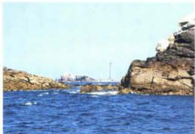
Une navigation aux confins de la Manche et de l'Atlantique, surveillée par le phare de l'île Vierge.

A peine quelques milles séparent les deux abers. Le paysage y est d'une richesse stupéfiante, se parant de toutes les couleurs de la Bretagne : blanc le sable des îles bordant les masses noires des rochers de granit, bleu profond l'eau mi-douce mi-salée des abers, vertes les