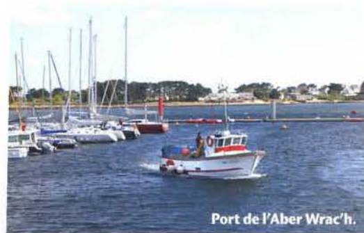
Port de l'Aber Wrac'h.