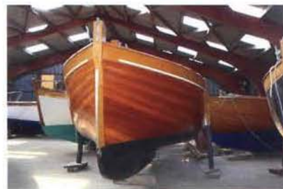
LE CHANTIER BEGOC. Des cotres construits à l'ancienne et aménagés à la carte.