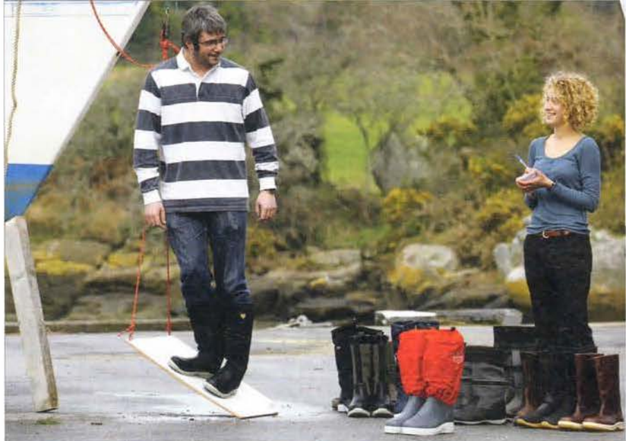
▲ Nous avons apprécié l'adhérence des différentes semelles à l'aide de ce dispositif réglable.

le Cordura d'Invista ou encore le Kevlar de DuPont, ces deux matériaux ayant l'avantage de bien résister à l'abrasion. Quant aux Neptune de Le Chameau, elles sont tout caoutchouc à l'extérieur, et doublées néoprène à l'intérieur : très confortable, très chaud – parfois trop... D'une manière générale, les bottes caoutchouc peuvent être doublées jersey (tricot léger) ou néoprène. Moins chère, la doublure jersey est aussi moins chaude, ce qui n'est pas plus mal par temps doux.