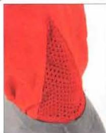
▲ Evacuation d'eau à la base de la guêtre.