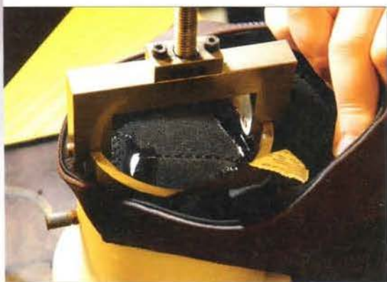
▲ Test d'imperméabilité peu concluant pour cette botte Sebago : l'eau passe par les coutures...