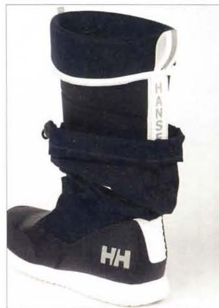
▲ La tige se replie ! Notez le renfort à l'arrière.